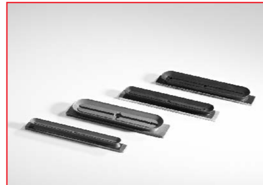
EP 30x100 ... EP 100x300

- оптимальные пластины для захвата реек и труб.