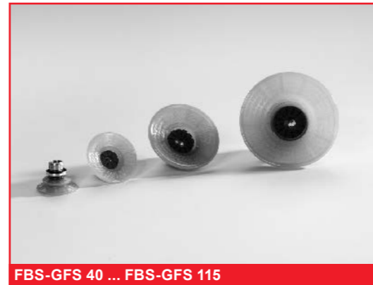
FBS-GFS 40 ... FBS-GFS 115