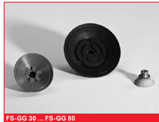
FS-GG 30 ... FS-GG 80